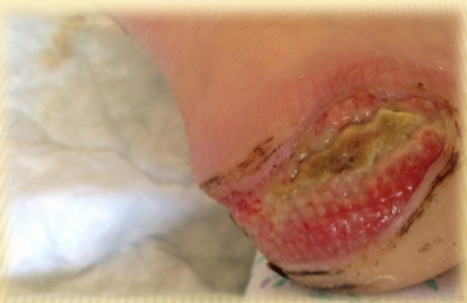
Пролежни на пятках