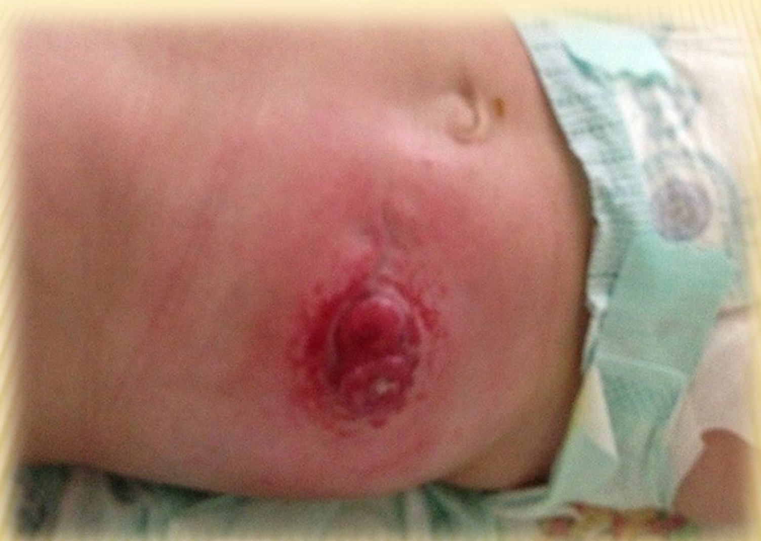
Ребенок Максим. Возраст - 6 мес. Мацерация кожи вокруг илеостомы.