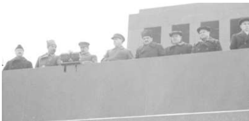
Руководители партии и правительства на трибуне Мавзолея В.И. Ленина во время военного парада, посвященного празднованию 24-й годовщины Великой Октябрьской социалистической революции. Автор В.А. Малышев. 7 ноября 1941 года. Главархив Москвы

Все были готовы к любому повороту событий. На случай бомбардировки Красной площади дежурили 35 медицинских постов, в их распоряжении были санитарные автомобили, пять восстановительных бригад, 15 пожарных и других специальных автомашин для работы при разрушении зданий, газовых и электрических сетей, возникновении пожаров.